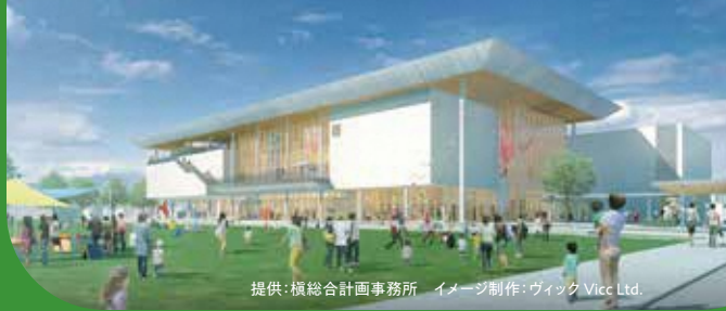
提供: 横総合計画事務所 イメージ制作: ヴィック Vicc Ltd.