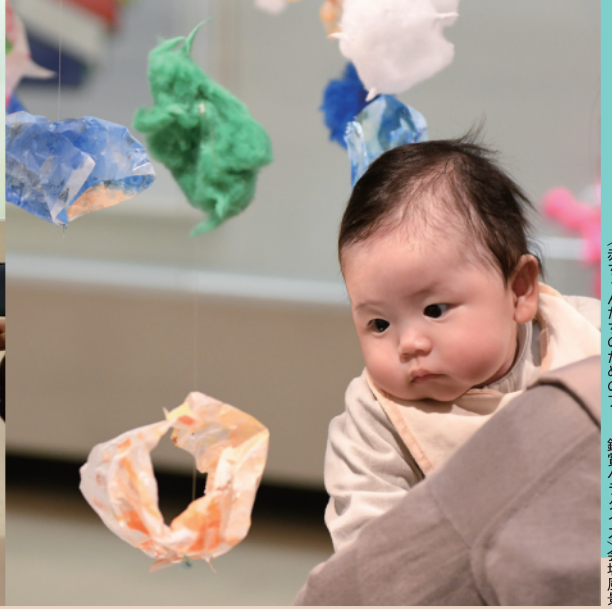
〈赤ちゃんたちのためのアート鑑賞パラダイス〉会場風景

2025年3月30日に開館する鳥取県立美術館では“みんなで作る美術館”をコンセプトに、その実現に向かって「子どもと美術館」などをテーマにオープンミーティングを行い、県民の皆さまにアイデアをいただき美術館の在り方や活動の可能性を探りました。