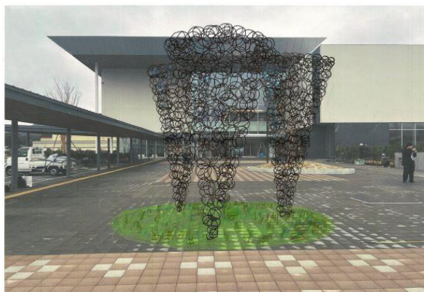
作品の設置イメージ

美術館の正面、エントリープラザのインターロッキング上に、コールドレン鋼製の円形の鋼材を溶接して組み上げた 3 つの逆円錐形状のモニュメンタルな鉄製彫刻が立ち上がる。高さは約 3.9 メートル。製鉄や鍛冶とも関連の深い鳥取県中部の産業文化の歴史も踏まえ、美術館と地域との境界となる場所に、それらをつなぐ鉄の彫刻を制作設置する。