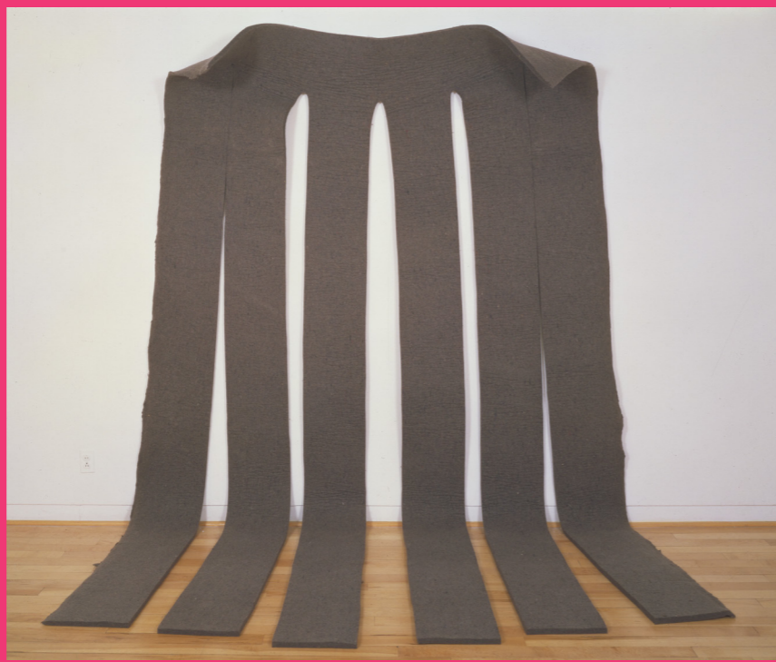
ロバート・モリス《無題》1968年 フェルト 大阪中之島美術館蔵 ©2024 The Estate of Robert Morris / ARS, NY / JASPAR, Tokyo G3731

第4章 20世紀後半には絵の具や金属板など素材そのものが作品化されるようになりました。物質や物体などいわば「むぎだしの現実」ともいえる美術表現となったのです。