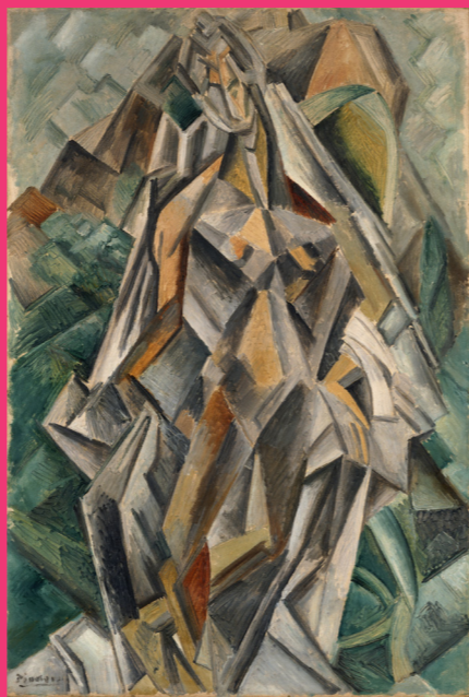
左: 鈴木其一《風神雷神図》(部分)江戸時代(19世紀) 絹本着色 東京富士美術館蔵 (*5/20~6/15展示予定) ©東京富士美術館イメージアーカイブ/DNPartcom 右: ハブロ・ピカソ《裸婦》1909年 油彩、カンヴァス ポーラ美術館蔵 ©2024 - Succession Pablo Picasso - BCF (JAPAN)

対象を「リアル」に表現することは、美術家たちにとって大きな課題でした。洋の東西、時代を問わず、美術の中には迫真性や写実性に向かう一つの方向性が認められます。しかし印刷術や写真術が発明され、私たちが目にするイメージが機械によっても複製、再現可能であることが明らかになった後、美術家たちは別の「リアル」を探求することになります。