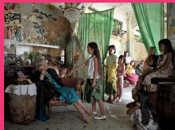
やなぎみわ《My Grandmothers All》2003年 発色現像方式印刷 鳥取県立美術館蔵