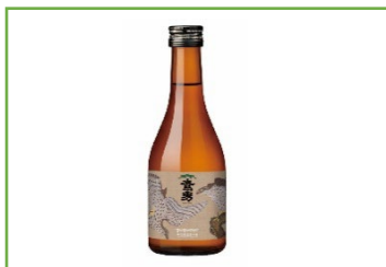
「いさまし鷹勇」 ¥1,200（税込）