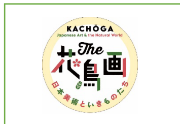
「The 花鳥画ロゴ缶バッジ」 ¥300（税込）