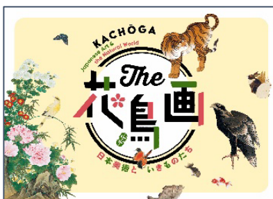
【図録】The 花鳥画 B5 ヨコサイズ/140 ページ ¥2,500（税込）