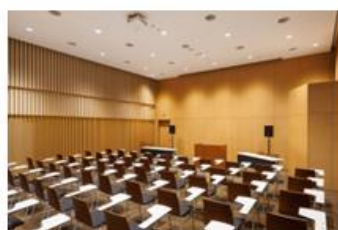
ホール 最大60席(可動) 講演会やレクチャー、上映会など それらに適した音響・映像設備を備える