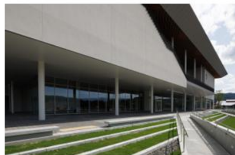
ひろま・えんがわ レセプションやその他式典・表彰式など。またユニークベニューとしての様々な利用