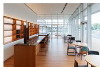
カフェ 店内18席、屋外16席 軽食の提供予定