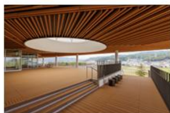
展望テラス ワークショップ・パフォーマンスなど またユニークベニューとしての様々な利用