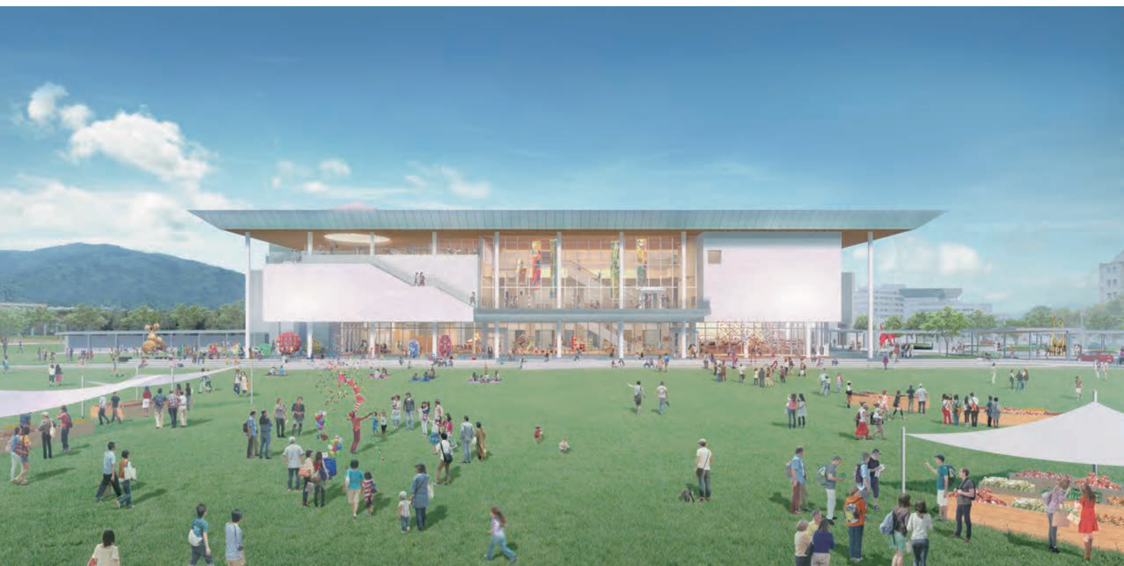
大御堂虎寺後を臨む鳥取県立美術館外観のイメージ（画像提供：横総合計画事務所／イメージ制作：ヴィック Vicc Ltd.）