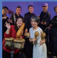
エストレージャス (サルサ&ラテンジャズバンド)

鳥取で活躍するジャンルの異なる4組のアーティストが「MY HOMETOWN 鳥取」をテーマに、一夜限りのサウンドを奏でます。